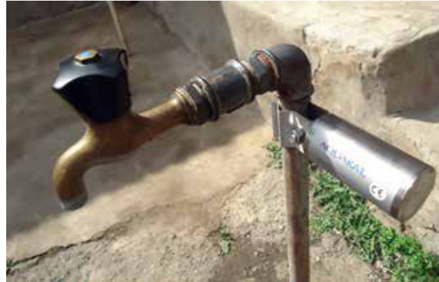
АquaKat, монтиран на дворна чешма - просто и ефективно! Виж повече на www.aquakat.info