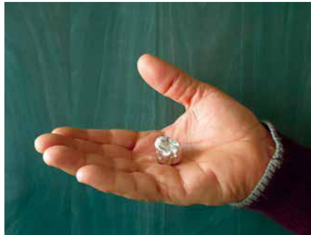
Бионосител за профилактика и лечение на растения. Виж повече на www.bionositeli.com