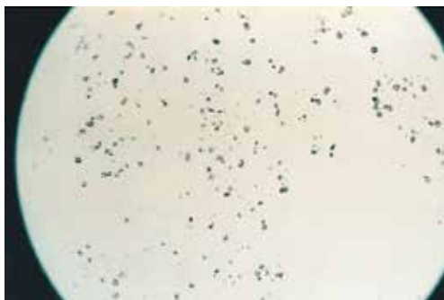
Калцитът е превърнат в арагонит след монтажа на AquaKat!