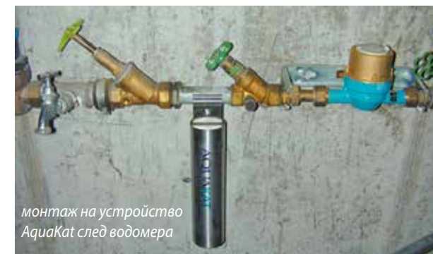
монтаж на устройство AquaKat след водомера